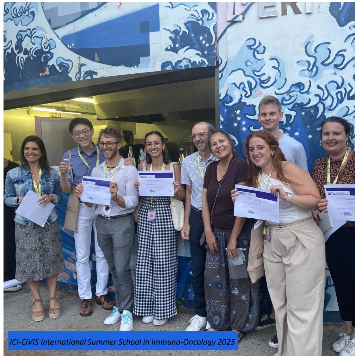
ICI-CIVIS International Summer School in Immuno-Oncology 2025

Atelier « Partage de réseau » printemps 2026