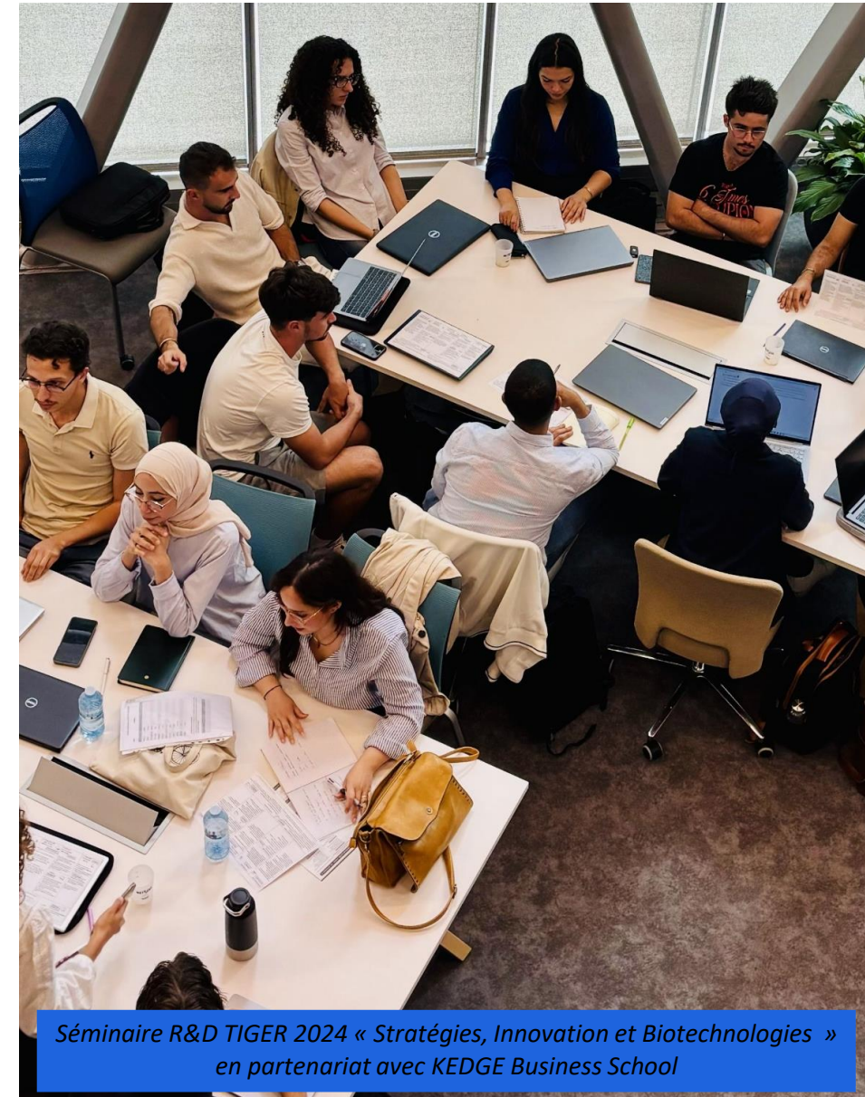
Séminaire R&D TIGER 2024 « Stratégies, Innovation et Biotechnologies » en partenariat avec KEDGE Business School